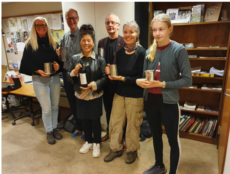
6 af de forvarende mestre årgang 2022. Der ses enkelte gengangere.

Pris: Kr. 50,- over 16 år, Kr. 25,- under 16 år for middagen. Klubmesterskabsløbet er GRATIS.