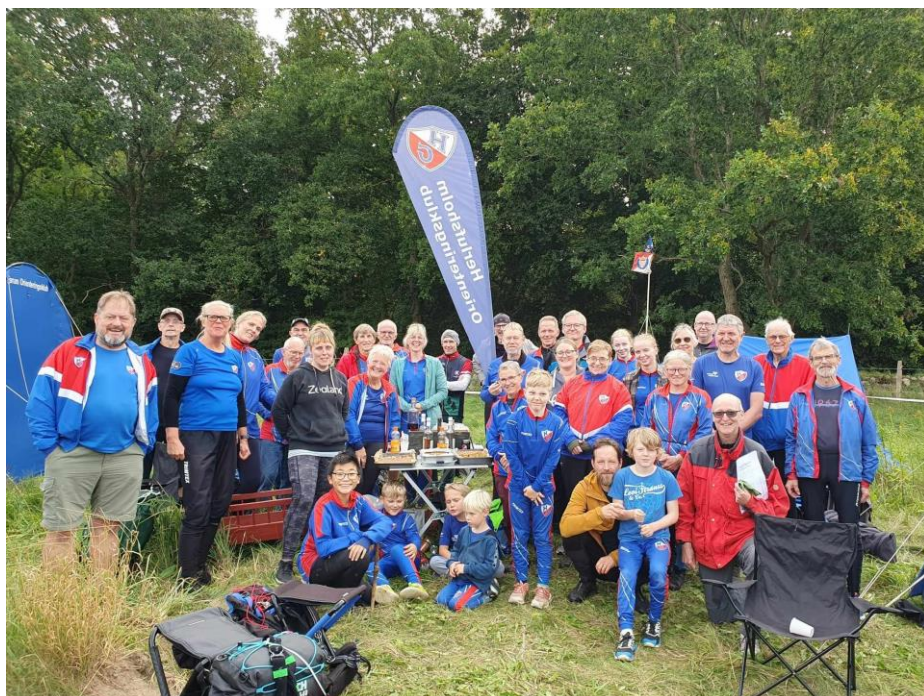
Fællesbillede fra op/nedrykningsmatch d. 01 oktober 2023 Måske går det bedre ved O-Ringen i 2024 ved Oskarshamn.