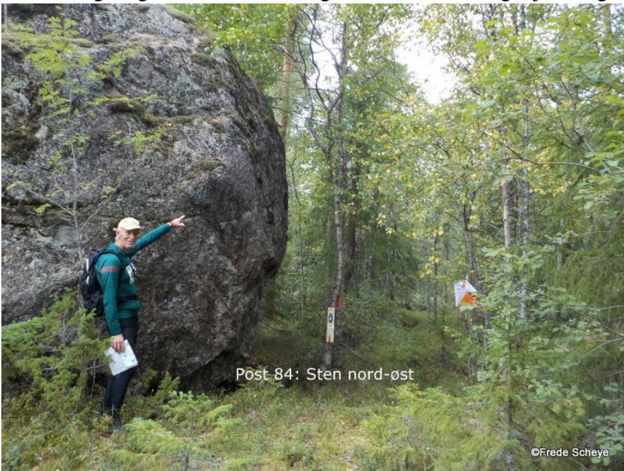
Post 84: Sten nord-øst

Det er muligt at gå til stævnecenter og få mad, men det tager jo tid og