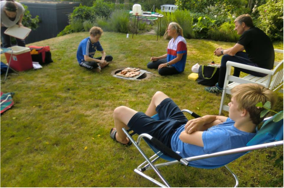
Den lækre grillmad nydes efter Skt Hans Løbet