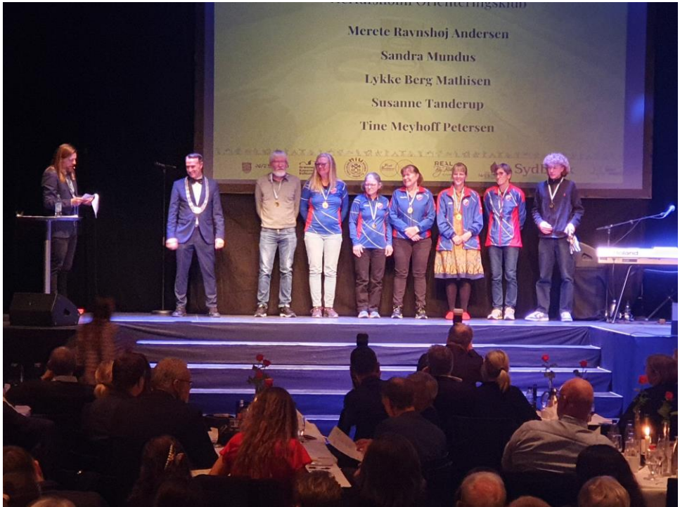
Kåring af klubbens DM-medaljetagere til årets Sport Awards