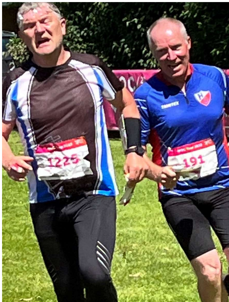
Sprint om at komme først i mål ved bysprint, VM, Vejle juni 2022